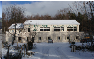
Verrières En Forez